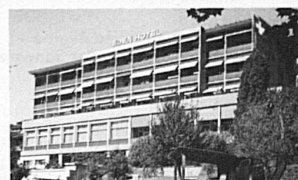
Eden Hotel****, 3700 Spiez Gepflegtes Familienhotel mit grossem Garten, Tennis und geheiztem Schwimmbad. Verlangen Sie unseren Prospekt. Telefon 033 54 11 54