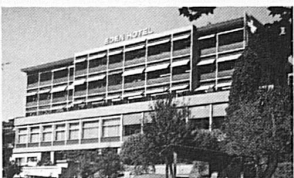
Edén Hotel****, 3700 Spiez Gepflegtes Familienhotel mit grossem Garten, Tennis und geheiztem Schwimmbad. Verlangen Sie unseren Prospekt. Telefon 033 54 11 54