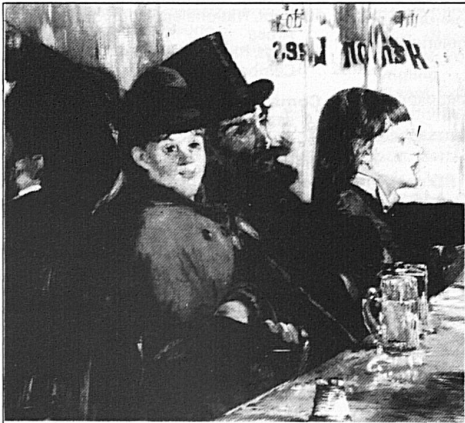
Edouard Manet, «Au café», 1878