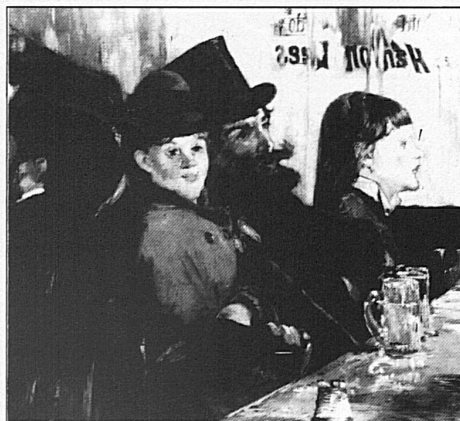
Edouard Manet, «Au café», 1878