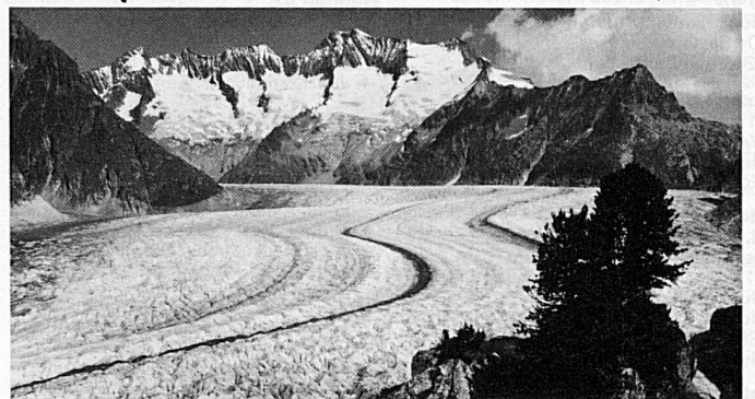
Aletschwald und Aletschgletscher, zwei der grossen Wanderziele der Alpen

Wir vermitteln Angebote für Ferien in Chalets oder Hotels. Teilen Sie uns Ihre Wünsche mit. Verkehrsbüro, 3981 Riederalp, 028 27 13 65