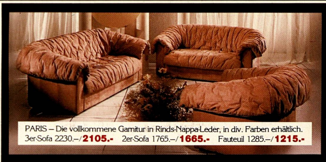
PARIS – Die vollkommene Garnitur in Rinds-Nappa-Leder, in div. Farben erhältlich. 3er-Sofa 2230.-/ 2105.- 2er-Sofa 1765.-/ 1665.- Fauteuil 1285.-/ 1215.-