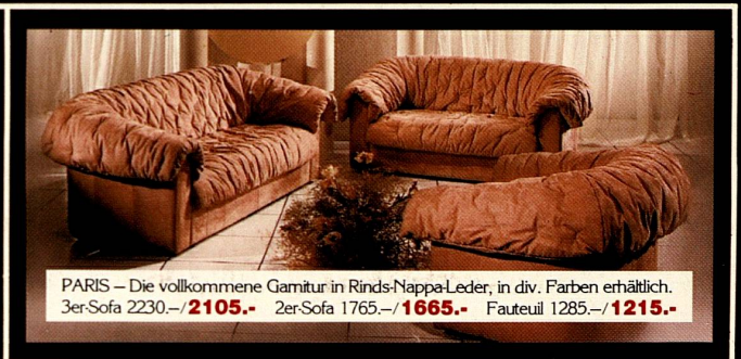
PARIS – Die vollkommene Garnitur in Rinds-Nappa-Leder, in div. Farben erhältlich. 3er-Sofa 2230.-/ 2105.- 2er-Sofa 1765.-/ 1665.- Fauteuil 1285.-/ 1215.-