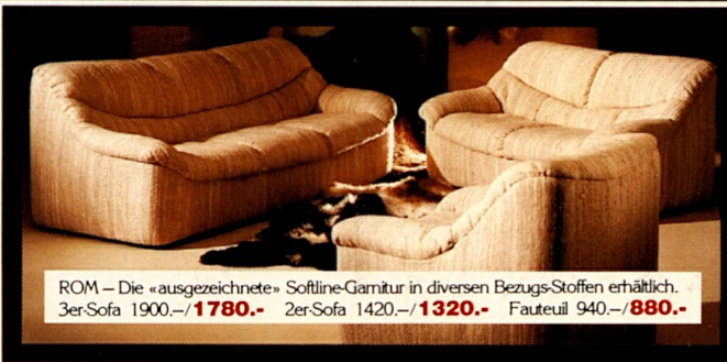
ROM – Die «ausgezeichnete» Softline-Garnitur in diversen Bezugs-Stoffen erhältlich. 3er-Sofa 1900.-/ 1780.- 2er-Sofa 1420.-/ 1320.- Fauteuil 940.-/ 880.-