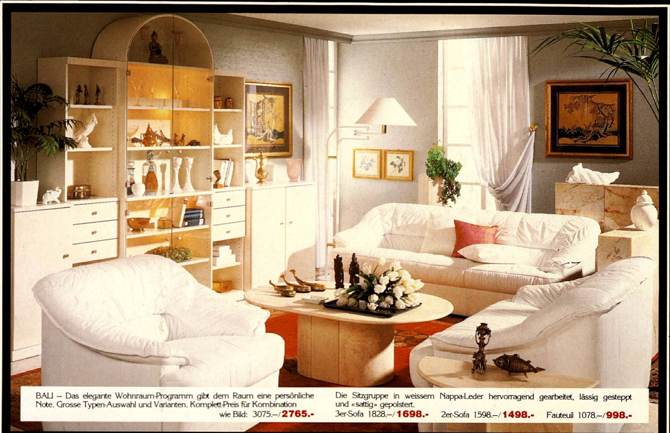
BALI – Das elegante Wohnraum-Programm gibt dem Raum eine persönliche Note. Grosse Typen-Auswahl und Varianten. Komplett-Preis für Kombination wie Bild: 3075.-/ 2765.-