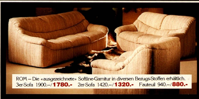
ROM – Die «ausgezeichnete» Softline-Garnitur in diversen Bezugs-Stoffen erhältlich. 3er-Sofa 1900.-/ 1780.- 2er-Sofa 1420.-/ 1320.- Fauteuil 940.-/ 880.-