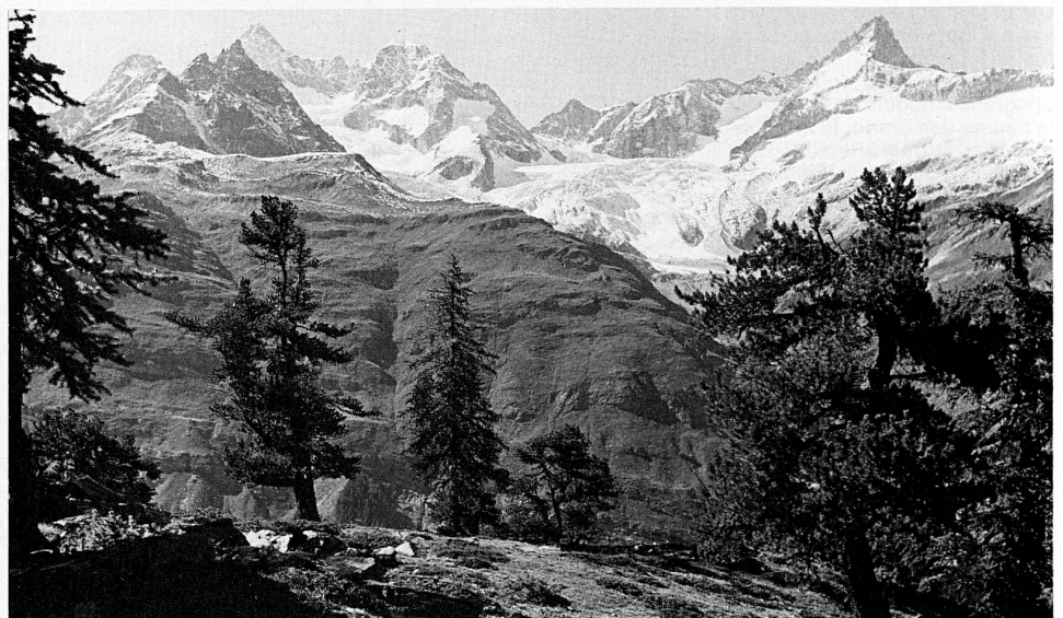
Wandergebiet Riffelalp bei Zermatt

Die Baumeler-Wandervögel aus der ganzen Schweiz treffen sich von Freitag bis Sonntag, 25. bis 27. Juni, im Binntal. Ein Strahler und ein Naturschutzaufseher machen die Teilnehmer mit der Bergflora und den Mineralien dieses Walliser Tals bekannt. Anmeldungen an Baumeler Reisen, Zinggendorstr. 1, 6000 Luzern 6, Tel. 041 50 99 00.