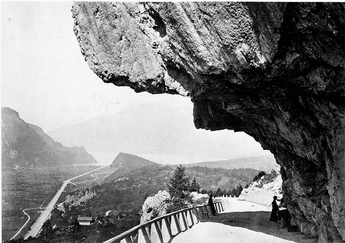
Alte Aufnahme der auf der Berner Seite 1862 vollendeten Brünigstrasse mit Ausblick auf Ballenberg und Brienzersee / Ancienne photo de la route du Brünig, achevée en 1862 du côté bernois, avec vue sur Ballenberg et le lac de Brienz / Vecchia fotografia della strada del Brünig, portata a termine nel 1862 su lato bernese; sullo sfondo il Ballenberg e il lago di Brienz An old picture of the Brünig road—completed on the Bernese side in 1862—with a view of Ballenberg and the Lake of Brienz