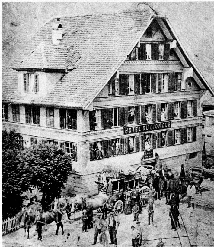
Verpflegungshalt der Brünig-Pferdepost beim Hotel Löwen in Lungern

der Schuh drückte. Stolz registrierten die Akten, dass mit der Postkutsche am Brünig im Jahre 1876 24 288 zahlende Passagiere befördert wurden und die Brünigpost der einzig rentierende Postkurs der Zeit gewesen sei.