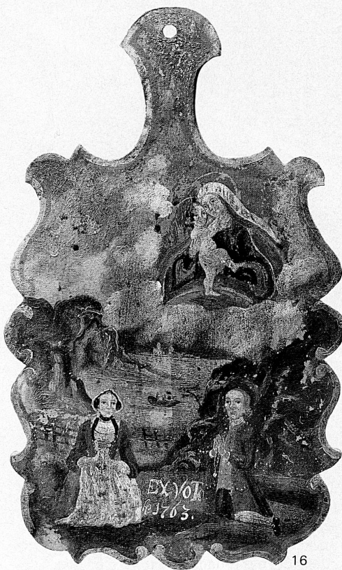
Das Votivbild in der Rengg-Kapelle am Landweg von Alpnach über den Rengpass nach Hergiswil zeigt vermutlich den Alpnachersee und links den Lopper

Le 14 juin 1888 le chemin de fer à vapeur Brienz–Alpnachstad put être inauguré (17). Le 1 er juin 1889, le second tronçon d'Alpnachstad à Lucerne fut mis en service en même temps que le chemin de fer du Pilate, tandis que le dernier tronçon de Brienz à Interlaken ne fut achevé que le 23 août 1916. Le chemin de fer du Brunig est le seul trajet à voie étroite du réseau CFF. Il a été électrifié en 1941/42. Tandis que le voyage de Lucerne à Interlaken durait encore six heures lors de l'inauguration du premier tronçon en 1888, il n'est plus aujourd'hui que d'une heure et cinquante minutes par l'express Lucerne–Interlaken.