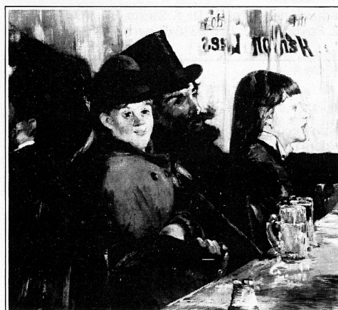
Edouard Manet, «Au café», 1878