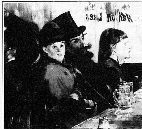
Edouard Manet, «Au café», 1878

geöffnet täglich 10–16 Uhr, Montag geschlossen