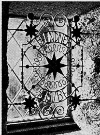
Das ist ein Beispiel für die Qualität der Bündner Spezialitäten.

Die Bündner Spezialitäten sind sehr vielfältig und von hoher Qualität. Sie sind ein wichtiger Bestandteil der Bündner Kultur und Tradition. Die Menschen sind stolz auf ihre Spezialitäten und sind bereit, sie mit anderen zu teilen.