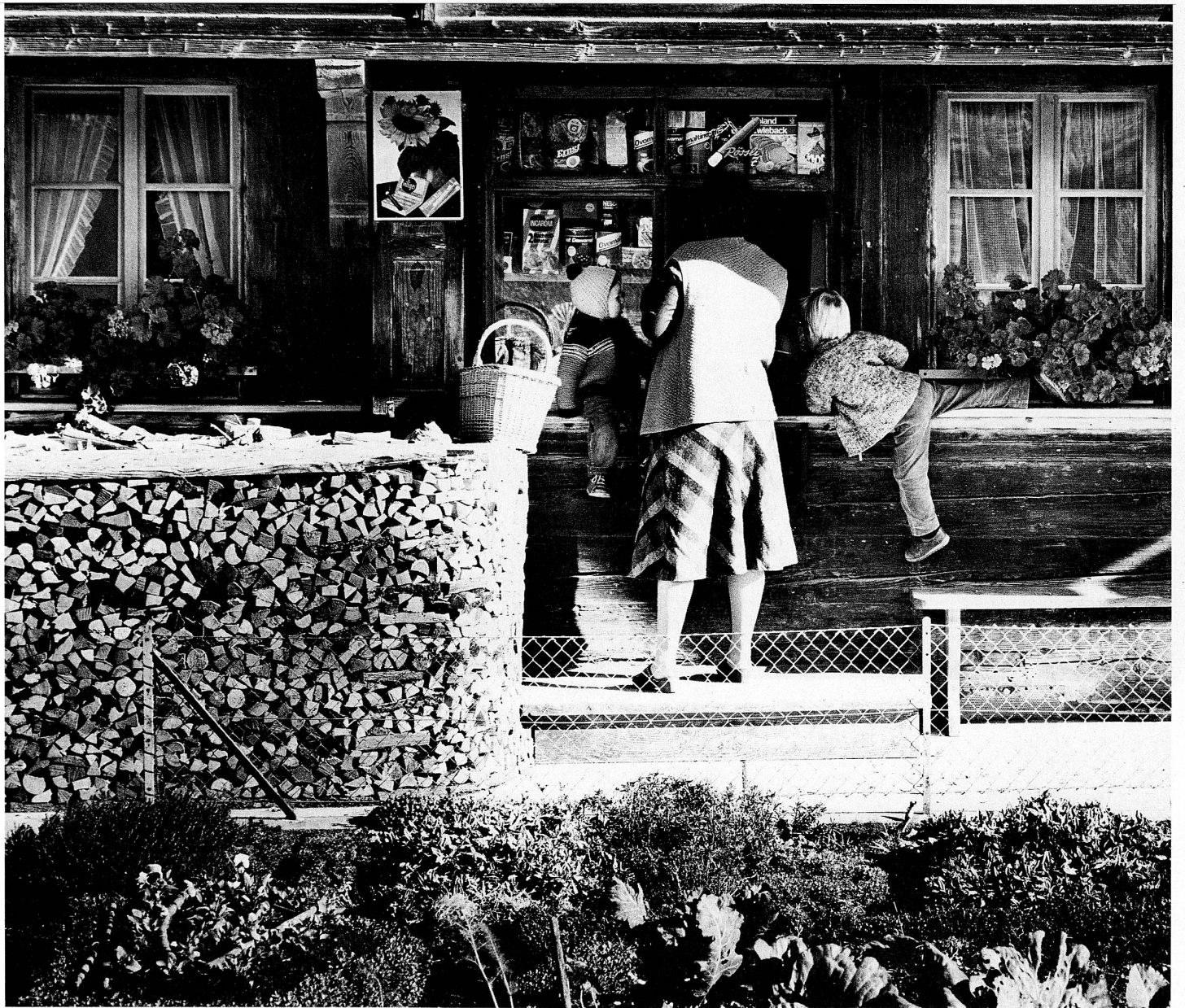
Lädeli bei der Horbenbrücke / Petit magasin près du pont de Horben / Negoziatello presso il ponte di Horben / A small country shop near Horben Bridge