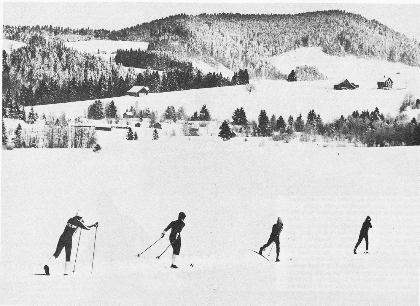
Bei Einsiedeln.