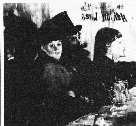
Edouard Manet, «Au café», 1878