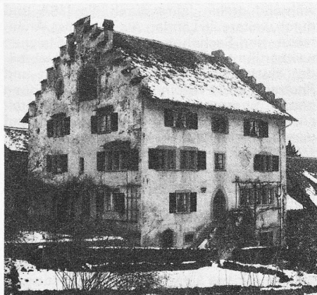
Das ländliche Baudenkmal der «Mülene» von Richterswil. Das Haupthaus mit dem markanten Treppengiebel stammt aus dem Jahre 1578. Die elf Firste umfassende Baugruppe ist Sitz der Heimatwerkschule, einer Volksbildungsstätte im Dienste der bäuerlichen handwerklichen Selbsthilfe

Das Schweizer Heimatwerk, das in verschiedenen Städten unseres Landes Verkaufsläden und in Richterswil eine eigene Heimatwerkschule unterhält, feiert dieses Jahr seinen 50. Geburtstag. In der Förderung der handwerklichen Selbsthilfe des Bauernstandes sahen die Gründer dieser Genossenschaft ihre erste Aufgabe. Es begann 1943 mit Kursen für Holzhandwerk im Urnerland. Kursleiter, die das Heimatwerk stellte, unterrichteten vor allem in Bergregionen. Einen wesentlichen Markstein in die Geschichte dieser handwerk-