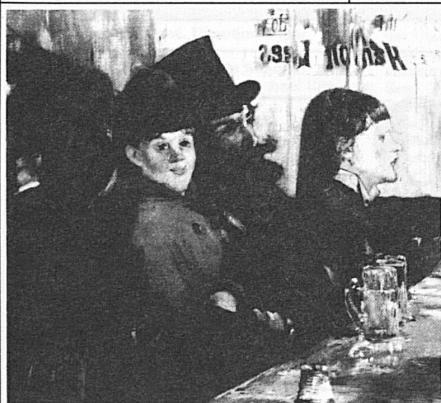
Edouard Manet, «Au café», 1878

Autocar postal direct de la gare de Berne, départ 14 h 05 et retour, départ de la Fondation Abegg 17 h 03.