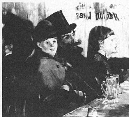
Edouard Manet, «Au café», 1878