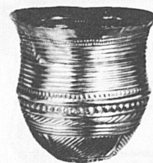
Goldbecher aus Eschenz TG Um 1700 v. Chr.