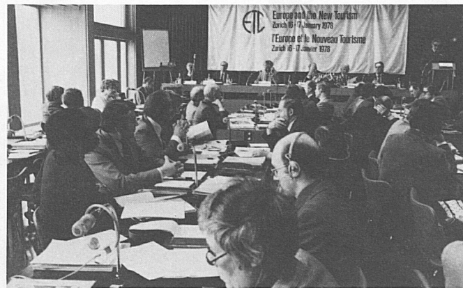
Vue générale de la réunion

Rund hundert Teilnehmer aus Westeuropa, Nordamerika und Japan – Vertreter von internationalen Verkehrszentralen, touristischen Organisationen und Unternehmen – trafen sich am 16./17. Januar im Gottlieb-Duttweiler-Institut in Zürich/Rüschlikon. Die Tagung wurde, in enger Zusammenarbeit mit der Schweizerischen Verkehrszentrale, von der «European Travel Commission» organisiert, welcher 23 nationale europäische Verkehrszentralen angehören. Im Vordergrund der Debatten stand das Thema «Aussichten des internationalen Tourismus in den achtziger Jahren».