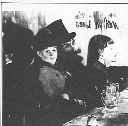
Edouard Manet, «Au café», 1878