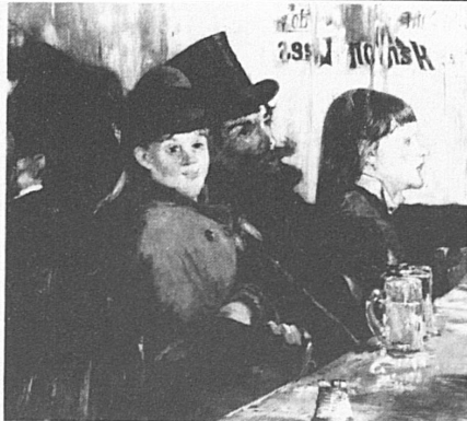
Edouard Manet «Au café», 1878