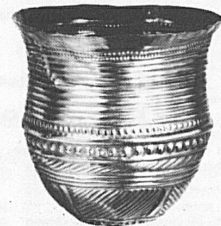
Goldbecher aus Eschenz TG Um 1700 v. Chr.

Das Napoleon-Museum Arenenberg ist mit Ausnahme des Montag- mittags täglich geöffnet: vom 1. Mai bis 30. September: 9-12 und 13.30-18 Uhr im April und Oktober: 10-12 und 13.30-17 Uhr vom 1. November bis 31. März: 10-12 und 13.30-16 Uhr November bis Februar den ganzen Montag geschlossen. Der Konservator bittet grössere Gesellschaften um Voranmeldung. Willi Hugentobler, 8268 Mannenbach Telefon: Schloss (072) 6 18 66, Wohnung 6 13 23