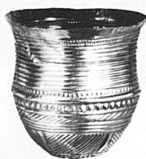
Goldbecher aus Eschenz TG Um 1700 v. Chr.

Tägl.: 10–12, 14–17, Mi 19.30– 21.30, Tel. 041 22 58 22