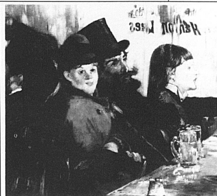
Edouard Manet, «Au café», 1878