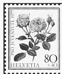
Rosa centifolia muscosa

Die Zeit der Rosen ist vergangen, Des Sommers Melodie verweht... Doch hier, im Markenbild gefangen, Der Rosen Schönheit neu erstet.