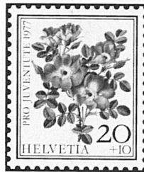
Rosa foetida bicolor