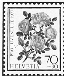
Rose foetida persiana