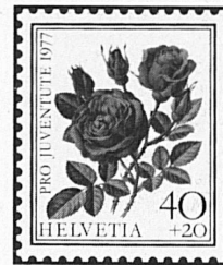
Rose à Parfum de l'Hay