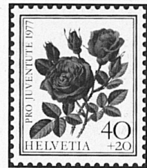
Rose à Parfum de l'Hay