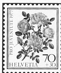
Rose foetida persiana