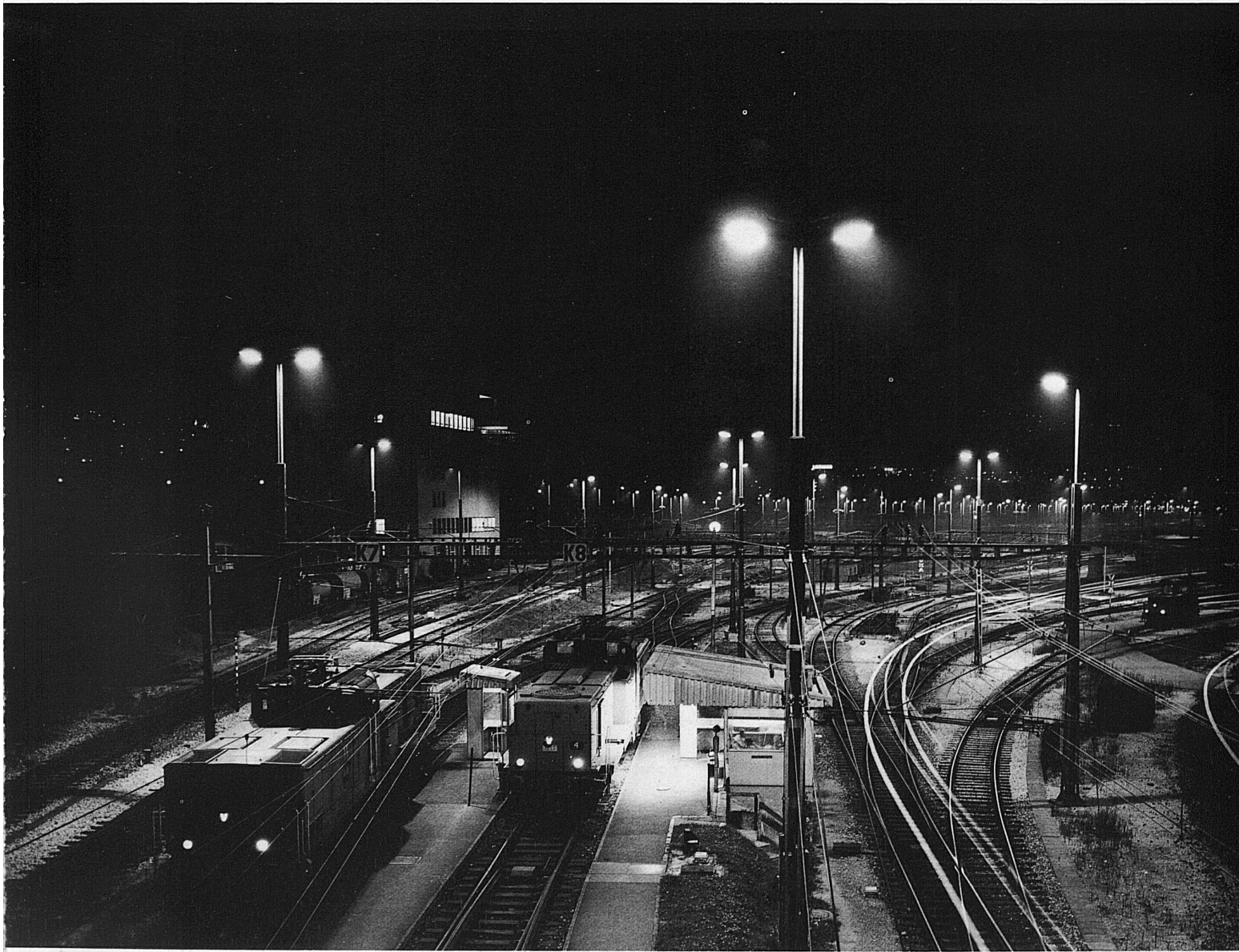
Der Rangierbahnhof von Chiasso am Südende der grossen Alpentransversale über den Gotthard. Über den Ablaufberg (im Vordergrund) rollen im Tagesdurchschnitt 2600 Güterwagen in die 19 Geleise der Richtungsgruppe. Aus diesen nach Richtungen geordneten Wagengruppen werden die Güterzüge nach Süden und Norden gebildet