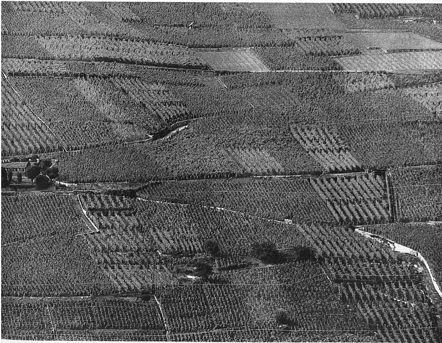
Die Kirche von Ligerz inmitten der Weinberge. Aufnahme von der Petersinsel aus

in dieser Gegend – und westlich dann weiter gegen Schafis hinunter, wo sein Name durch eine Haltestelle der Ligerz-Tessenberg-Bahn, die ihn dort überschneidet, verewigt ist. Da die Wallfahrtskirche zugleich als Gemeindekirche dienen musste, blieb sie erhalten.