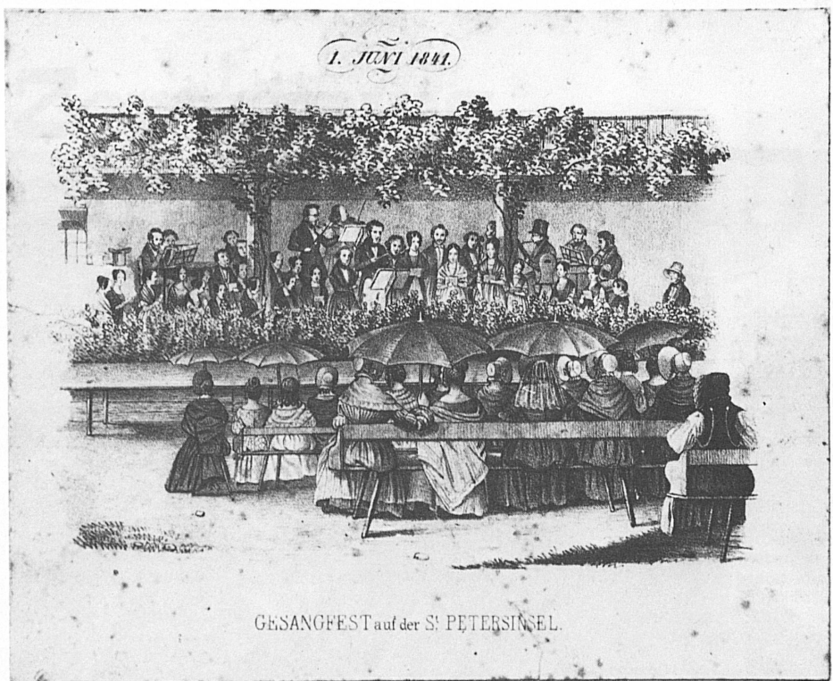
GESANGFEST auf der S. PETERSINSEL.