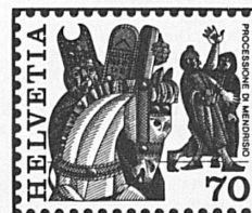
Processione di Mendrisio