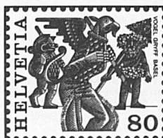
Vogel Gryff Basel