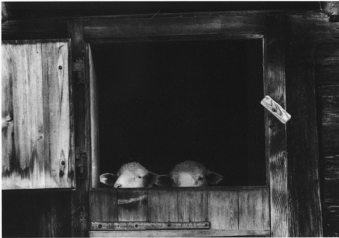
Vordemwald AG und Vrin GR.