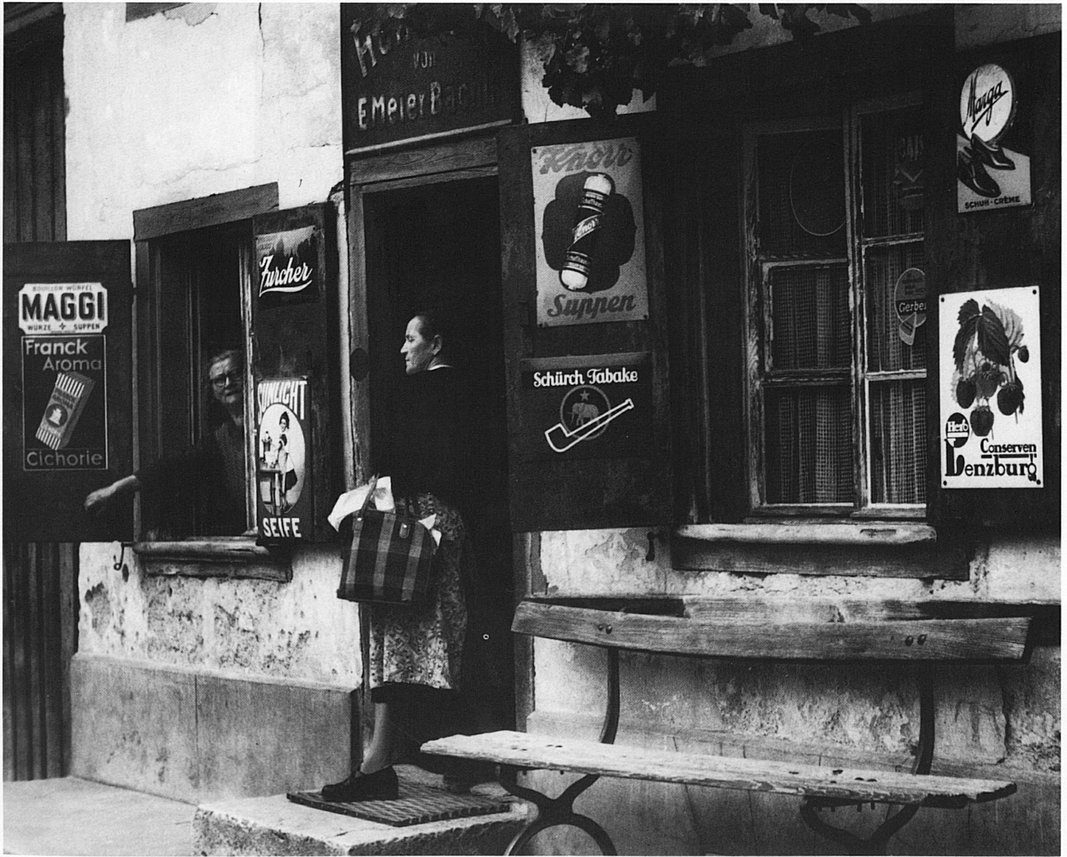
Würenlingen AG.