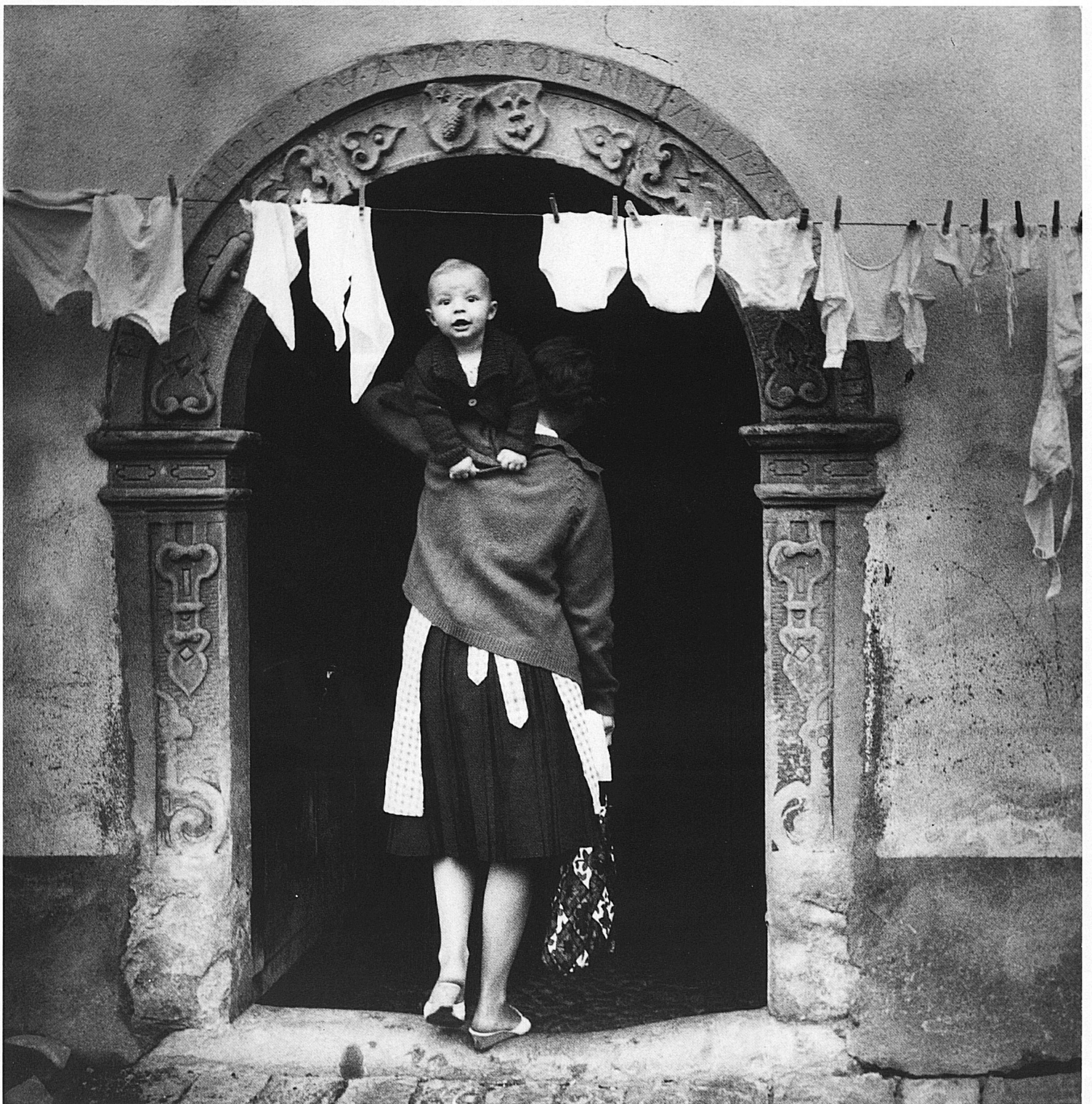
Brunnadern SG, Photo B. Kircharaber

Mit Türen leben Les portes dans la vie quotidienne Presenza delle porte Living with doors