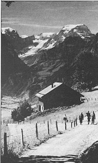
BRAUNWALD. Das autofreie Wanderparadies mit Tödi (3620 m) im Hintergrund

Das ruhige Tal zwischen dem blaugrünen Walensee und den Eiskuppen des Tödi