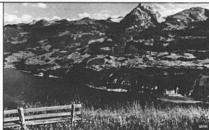
Blick über den Walensee auf die Glarner-Alpen.

Auskunft: Verkehrsbüro 8784 Braunwald Tel. 058 84 11 08 Automat. Information 84 35 35