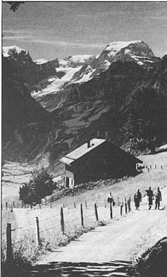
BRAUNWALD. Das autofreie Wanderparadies mit Tödi (3620 m) im Hintergrund

Das ruhige Tal zwischen dem blaugrünen Walensee und den Eiskuppen des Tödi