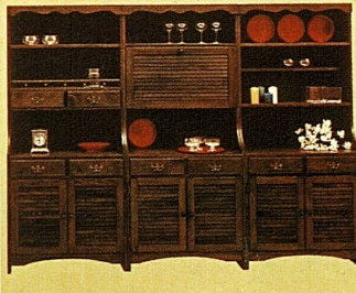
Mod. 29.061 Toledo-Bufferet «Bonanza», kastanienbraun gebeizt, 3teilig mit origineller Einteilung wie Bild nur 985.-