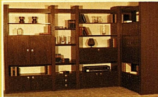
Mod. 42.209 Element-Wohnwand, 3teilig, in echt Eiche, 100% Schweizer Qualität, nur 877.-

Gleiche Ausführung, jedoch in 4teiliger Kombination nur 1242.— als Eckkombination nur 1327.—