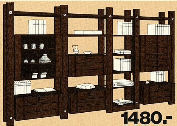
Mod. 42.230 Exklusive Element-Wohnwand in echt Eiche, ca. 375 cm breit, 100 % Schweizer Qualität, beliebig zusammenstellbar mit Geschirrschrank, Hausbar und Vitrine frei Haus geliefert 1690.—, bei Mitnahme sogar nur 1480.— ... damit Sie anderswo nicht Fr. 305.— zuviel bezahlen!