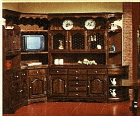
Pionier-Stil-Wohnwand, ausmassiver nordischer Kiefer, tadellos verarbeitet, Elemente bereits ab 318.-