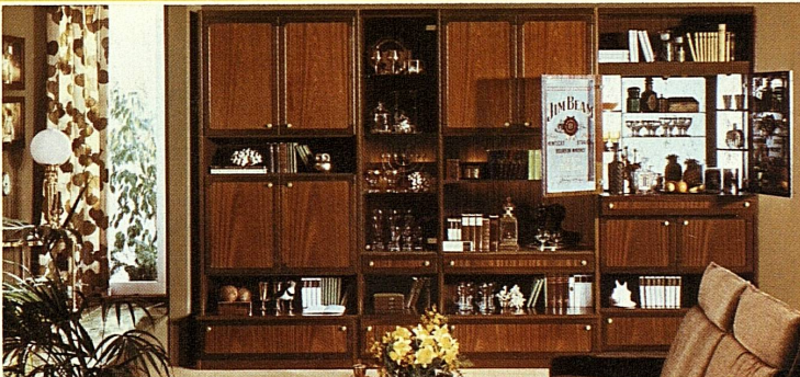
Mod. 42.223 Ein Traum in Mahagoni — eine Element-Wohnwand von bezaubernder Schönheit, aufwendig gearbeitet mit maximalem Finish, einzigartig ausgestattete Luxus-Bar, alle Elemente beliebig zusammenstellbar, wie Bild nur 3140.-

Möbel Märki ...einer für alles... Teppiche-Vorhänge Bad-Bett-wäsche