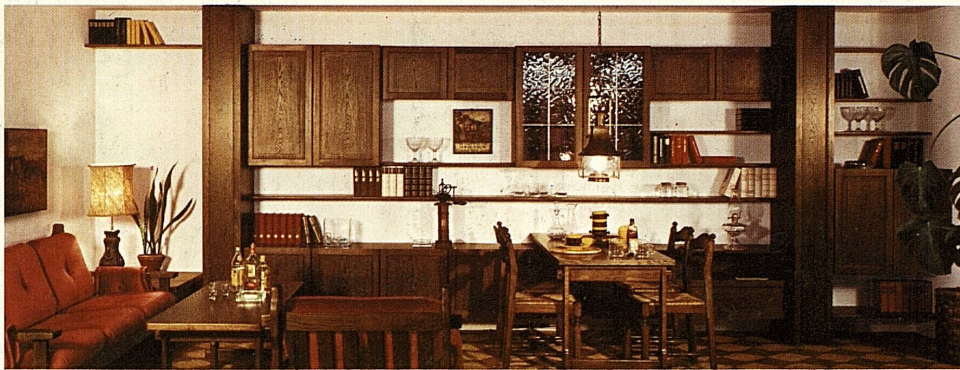
Mod. 42.170 Wandelemente nach Mass — die neue Wohnzukunft! ... zurecht zählt diese Anbauwand zum Schönsten, was heute der Markt bietet. Die Wand weist optimale Bedingungen sowie einen individuellen Charakter auf. Diese Elemente zählen zu den wandlungsfähigsten und anspruchsvollsten Einrichtungen und sind in 15! verschiedenen Hölzern und Ausführungen lieferbar. Für unverbindliche Offerte bitte genaue Raummasse mitbringen!