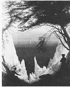
Caspar David Friedrich, Kreidefelsen auf Rügen

geöffnet täglich 10–16 Uhr, Montag geschlossen