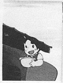
Heidi y su abuelito, que no es tan...