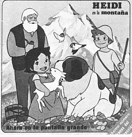
Ahora en la pantalla grande