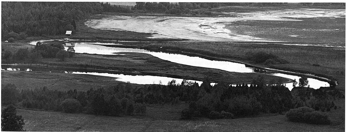
Orbemündung in den Lac de Joux / Embouchure de l'Orbe dans le lac de Joux

Für die wachsende Bevölkerung, die sich aus der Landwirtschaft allein nicht mehr ernähren konnte, bot die schon früh angesiedelte Industrie zusätzliche Arbeit. Eisengewinnung, verbunden mit Köhlerei und Metallverarbeitung, gehen bis ins 14. Jahrhundert zurück. Im 18. Jahrhundert wurde sie abgelöst durch die Uhrenfabrikation, heute die wichtigste Verdienstquelle des Tales.