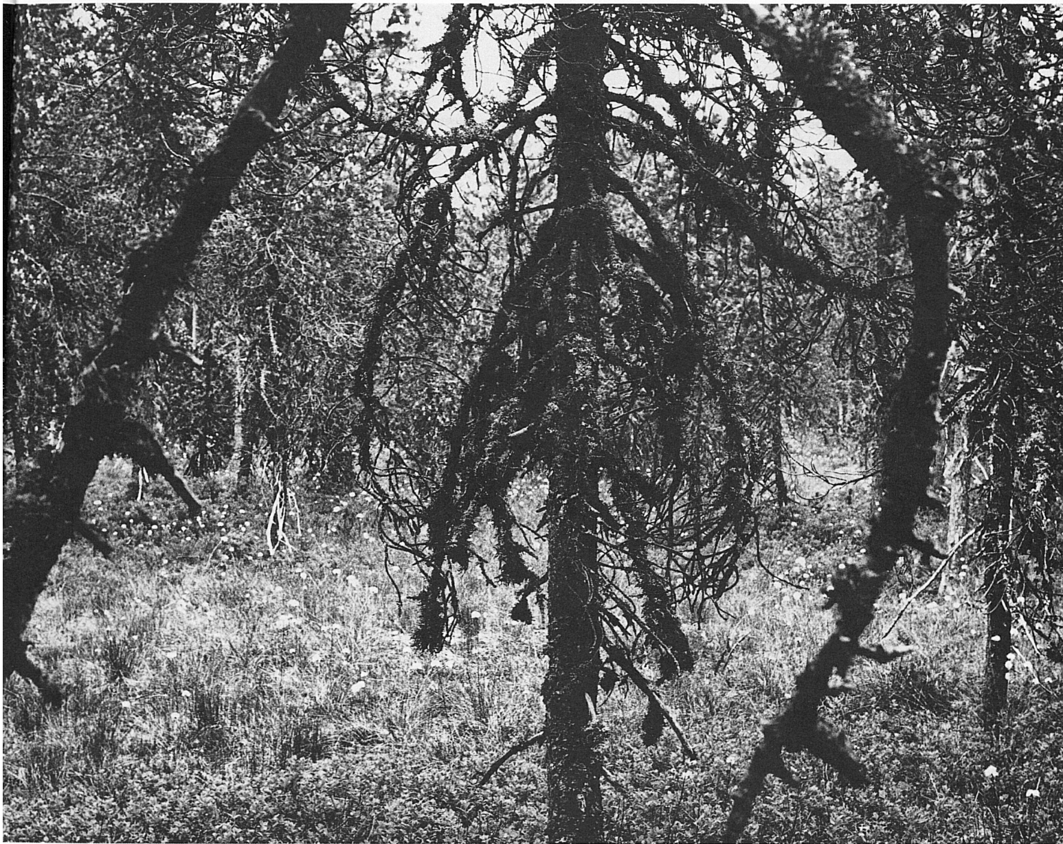
Les Sagnes de la Burtignière (tourbières, Torfmoor)