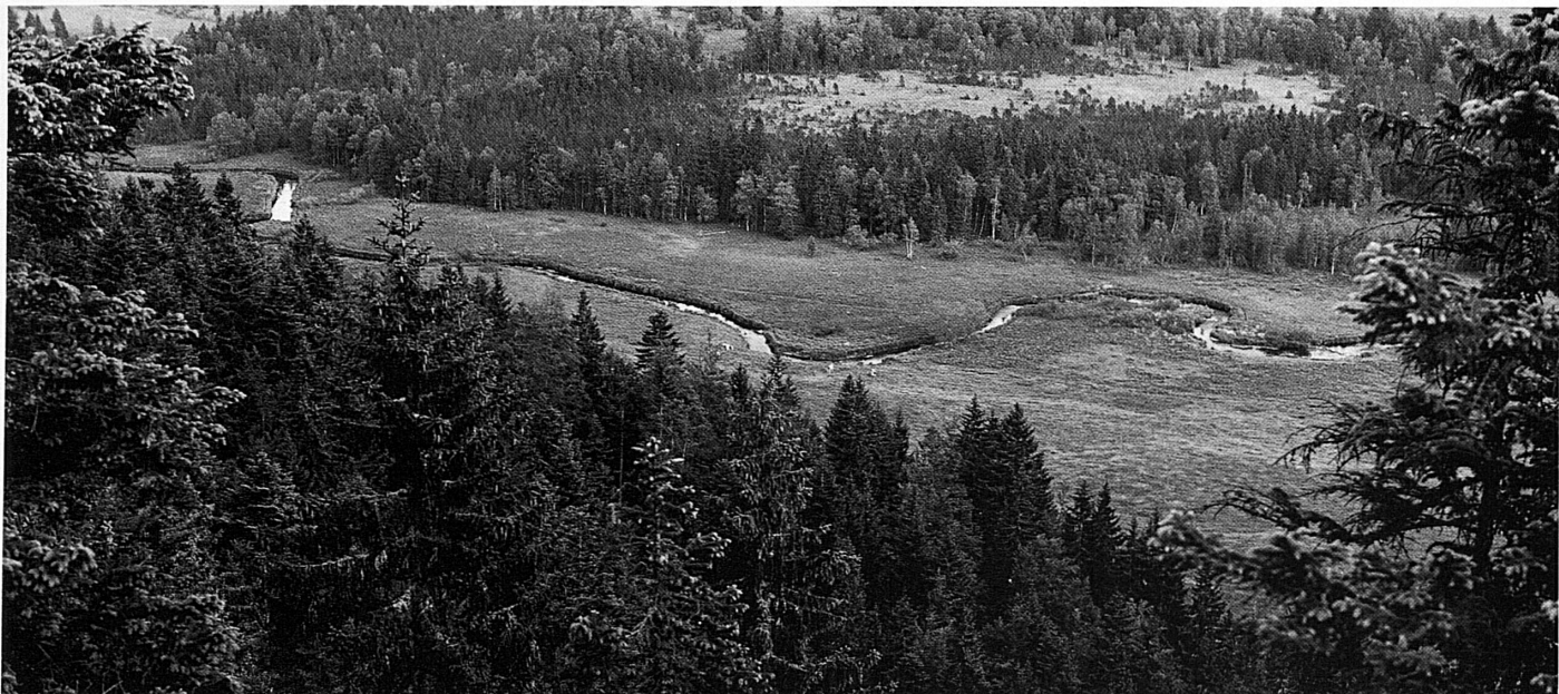
Mäandrierende Orbe zwischen Grenze und Lac de Joux / Méandres de l'Orbe entre la frontière et le lac de Joux