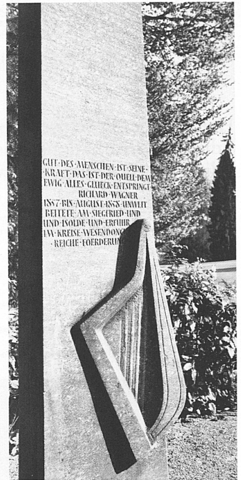
Eine Stele im Park des Museums Rietberg, ehemals Villa Wesendonck, erinnert an die Zeit, die Wagner als Nachbar und Freund des Ehepaars Wesendonck auf dem «grünen Hügel» in Zürich-Engelberg verbrachte.

Mehr noch: Ihm wurde klar, dass das im Entstehen begriffene Werk auf den damaligen Theatern gar nicht aufgeführt werden konnte. Erstmals taucht der Gedanke eines eigenen Festspielhauses auf! Und wo war für seine Götter, Riesen, Drachen, Walkürenfelsen, für Nibelheim, der geeignetere Platz als dort, wo er die bestimmenden Eindrücke empfing! In Brunnen, im Vierwaldstättersee, das Publikum am Ufer, die Bühne mit Durchblick auf Urirotstock, Gitschen und Bauen, plante er sein Festspielhaus! Eine grandiose Idee und ein Hinweis darauf, wie das Ganze gedacht war. Auch seinen Wohnsitz wollte er nach Brunnen verlegen, der Bauplatz war schon bestimmt. Oberst auf der Maur, der weit-sichtige Wirt vom Goldenen Adler (heute Hotel Elite), wollte Wagner Haus und Land mietweise zur Verfügung stellen. Wagner war nun oft in Brunnen, und wenn er Gäste aus Deutschland hatte, führte er sie mit Vorliebe dorthin. Auch mit der Bevölkerung hatte sich ein freundschaftlicher