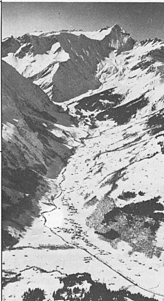
Flugaufnahme Elm im Sernftal Blick gegen Hausstock

Familie H. Frey-Marfurt Tel. 058 86 14 57