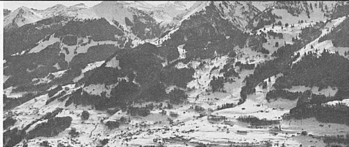
Filzbach mit Mürtchenstock

Autom. Schnee- und Wetterbericht Telefon 058 84 35 35