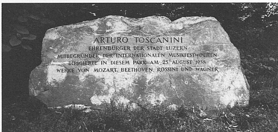
First International Music Festival of Lucerne, 1938: Arturo Toscanini conducts a concert in front of the Wagner house at Tribtschen

1938 – prime Settimane musicali internazionali a Lucerna. A Tribtschen, davanti alla casa di Wagner, Arturo Toscanini diresse un concerto