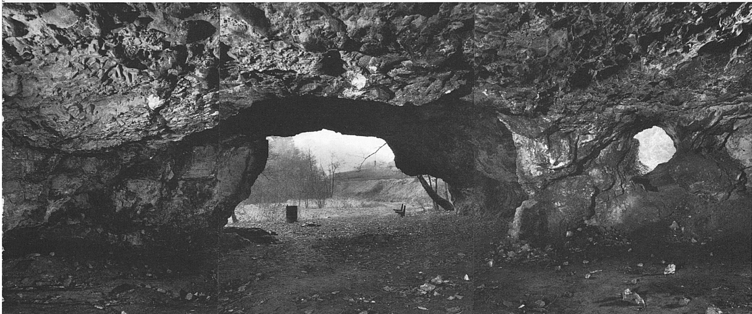
Das Kesslerloch heute / Le Kesslerloch de nos jours Il Kesslerloch attualmente / The Kesslerloch today

Le Kesslerloch est une grotte calcaire non loin de la gare de Thayngen, entre Schaffhouse et Singen. On y a découvert des vestiges de vie humaine datant de la phase finale de la période glaciaire, soit du paléolithique supérieur 15 000 à 10 000 ans avant notre ère. Plusieurs objets portent des dessins gravés représentant des rennes, des chevaux sauvages, des mammoths. Le «renne broutant» est célèbre. De même la pointe de javelot, reproduite à gauche, est particulièrement belle. Les objets des fouilles sont exposés au Musée de Tous-les-Saints à Schaffhouse, où l'on peut voir aussi le diorama représenté au-dessus, à titre de comparaison.