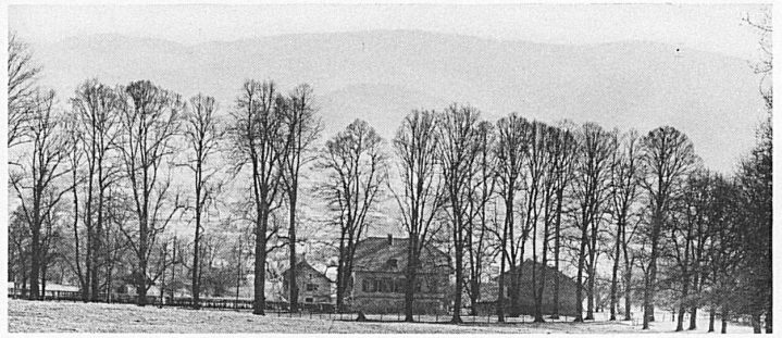
Le Mexique – am Weg zur Vorburg bei Delémont

mit dem Auto ins Mendrisiotto – seiner ausgedehnten Äcker, Tabak- und Rebenerfelder wegen die schweizerische Toskana genannt – über Novazzano (kirchliche Kunstdenkmäler), Brusate, Stabio (eisenschwefliges Mineralbad), Ligornetto (Vela-Museum) nach Mendrisio.