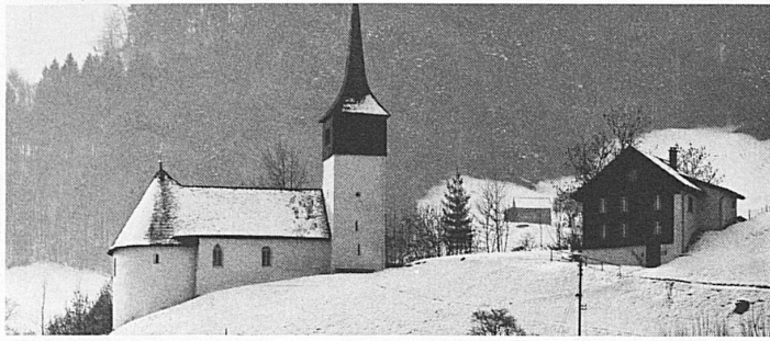
Johannesburg – bei Lachen am oberen Zürichsee