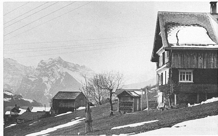
Roma – mit Alpenblick bei Amden