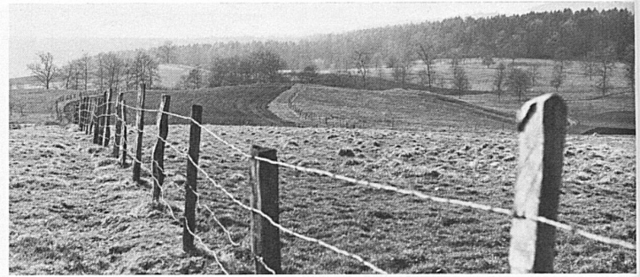
L'Algérie – Wiesland westlich von Delémont

Das Gute liegt so nah – selbst die weite Welt. Warum also in die Ferne schweifen, wenn man auch bei sich zu Hause eine Weltreise unternehmen könnte? Zum Beispiel anhand der Schweizer Landeskarte 1:25000. Die Fahrt geht gemütlich mit Auto, Bahn oder Postauto, aber auch per Schiff und Velo oder zu Fuss. Und dies ohne Visa und Schutzimpfung. Vielleicht besteht eine fremdländisch klingende Millionenstadt nur aus einem Bauernhaus oder ein ganzer Kontinent nur aus einem Stück Grasland. Was tut's? Denn möglicherweise stossen Sie gerade dort auf ein Stück Schweiz, das zu entdecken sich lohnt.