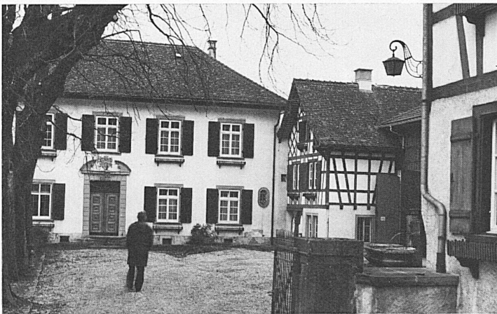
Heidelberg – ein Gutshof bei Bischofszell

Nach einer Reise durch die halbe Schweiz landen wir in Vorderasien. Die