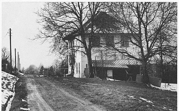
Neu York und sein Broadway – bei Rüti ZH