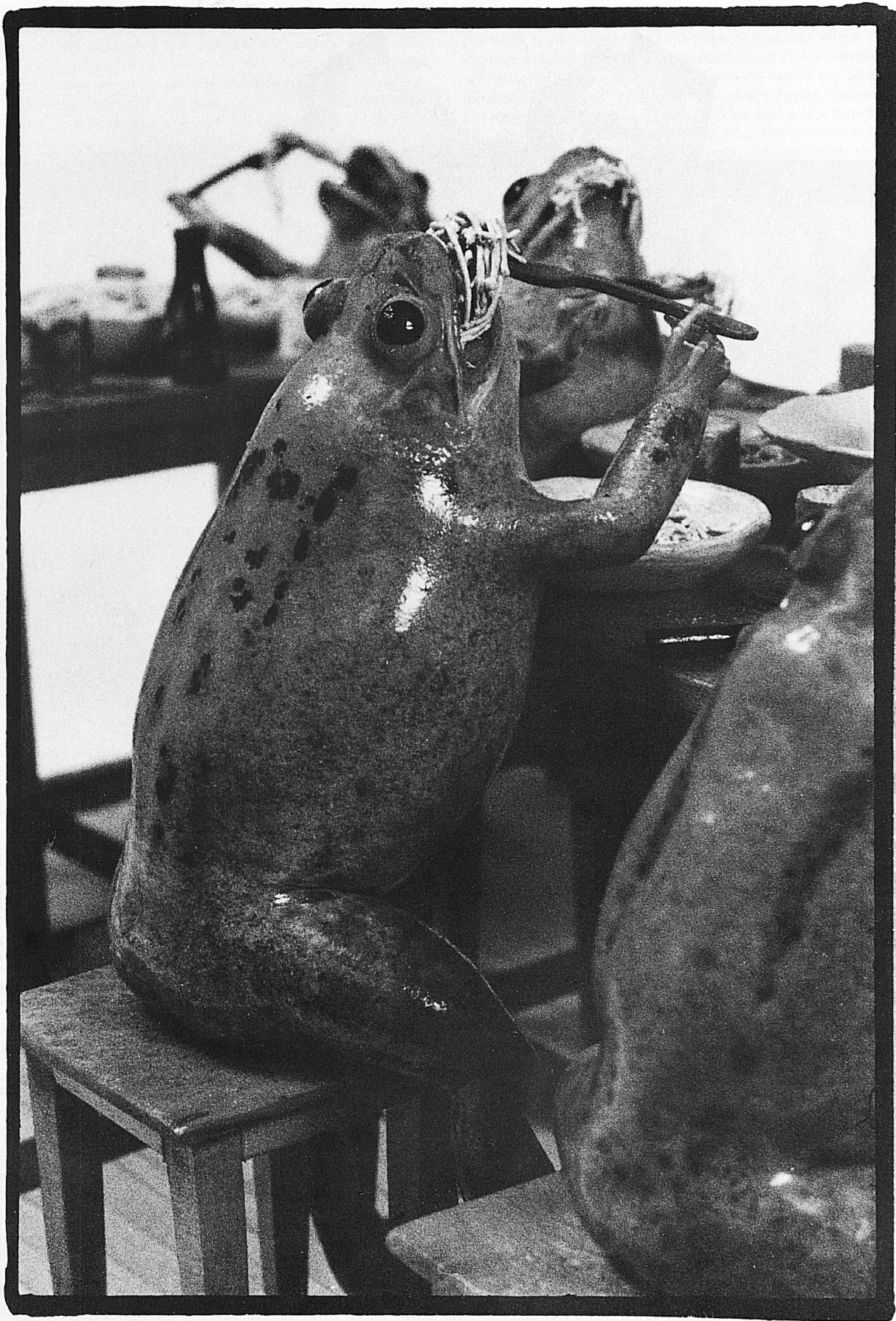
Am Familientisch / Le dîner de famille / Il desco familiare / The family meal

Scènes burlesques composées avec des grenouilles naturalisées au Musée local d'Estavayer-le-Lac Burleske Szenen mit konservierten Fröschen im Heimatmuseum Estavayer-le-Lac