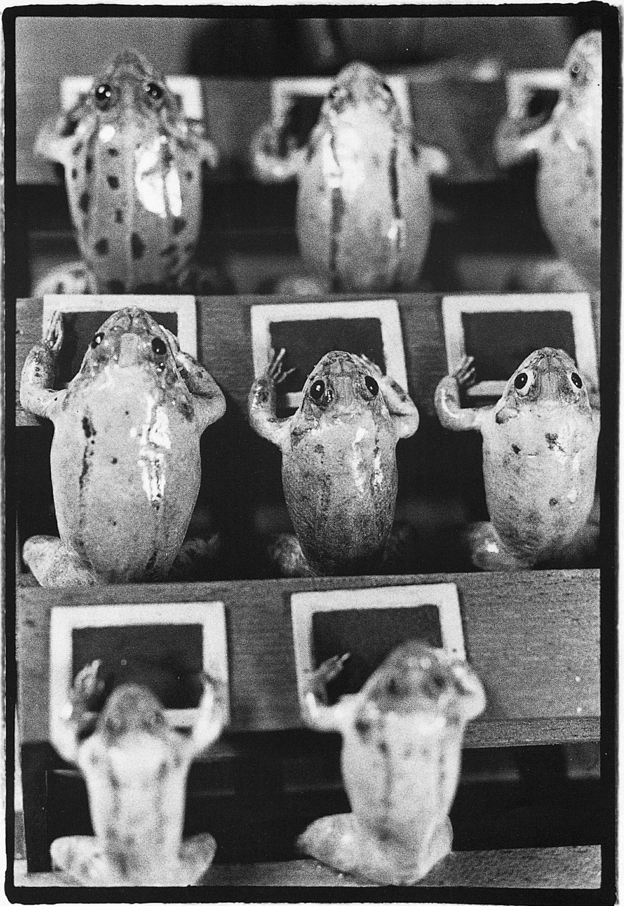
In der Schule / L'école / A scuola / At school

Scene burlesche con alcune rane conservate nel Museo dell'artigianato popolare di Estavayer-le-Lac Burlesques with preserved frogs in the local museum of Estavayer-le-Lac