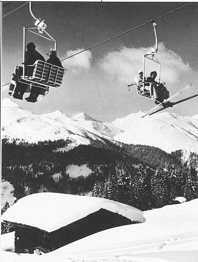
Sessellift Glaris-Rinerhorn (Davos)