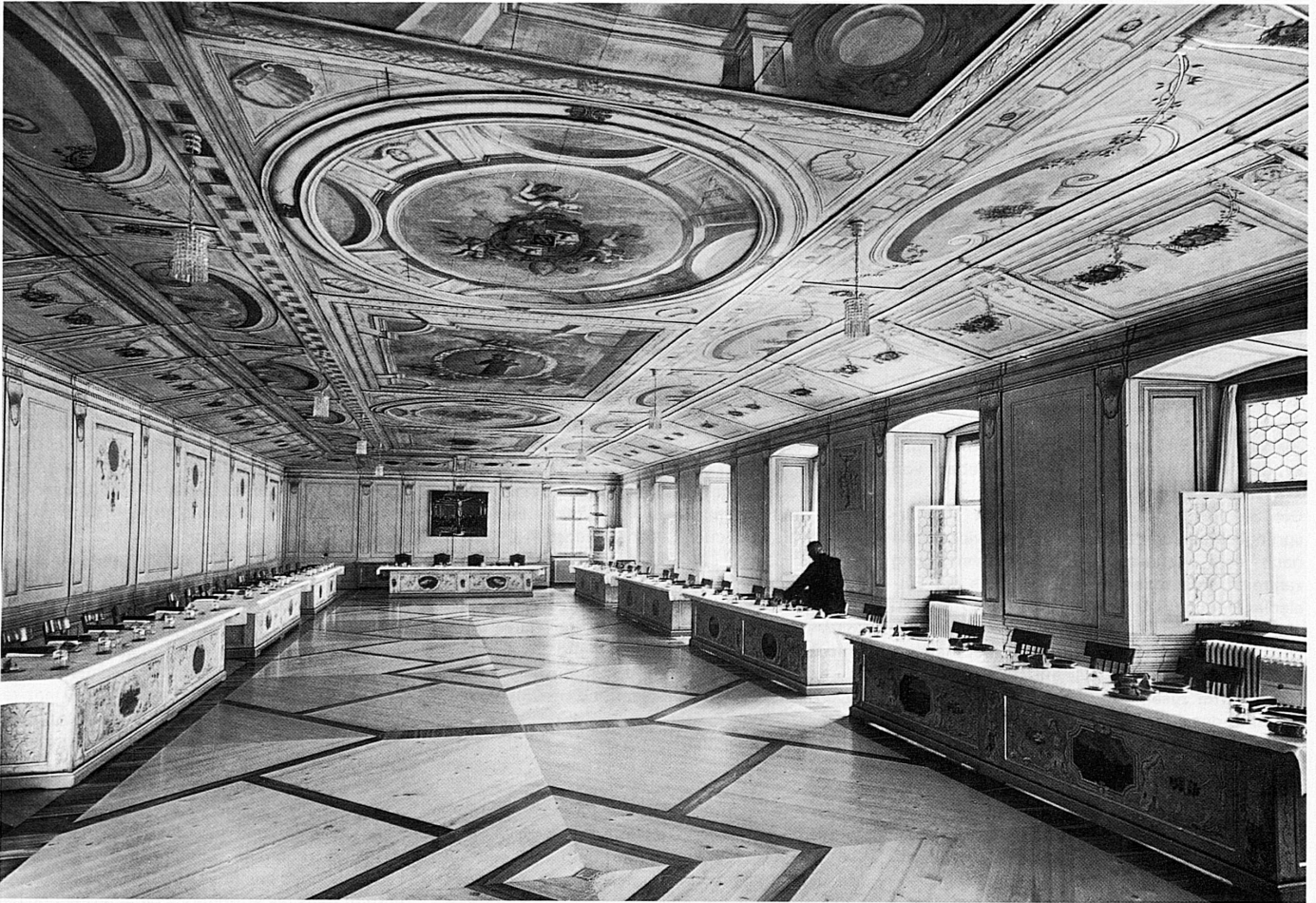
Zentrale Begegnungsstätte der klösterlichen Gemeinschaft ist der Kreuzgang, der in der Regel südlich an die Klosterkirche anschliesst. Hölzerner Kreuzgang (17. Jahrhundert) der ehemaligen Benediktinerabtei Beinwil im solothurnischen Lüsseltal.

Le cloître est le lieu de rencontre de la communauté monastique; il se trouve généralement au sud et communique directement avec l'église du couvent. Cloître de bois du XVII e siècle, dans l'ancienne abbaye bénédictine de Beinwil