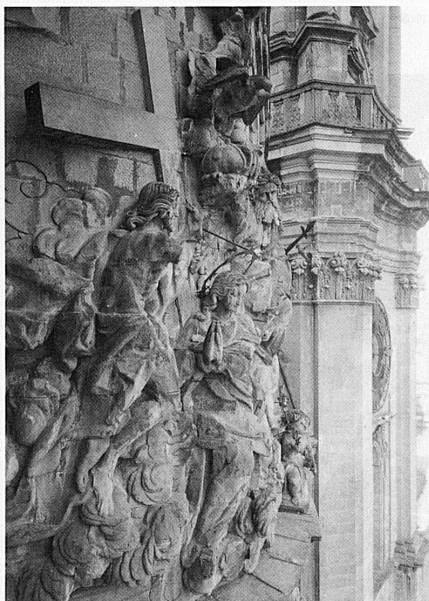
Restaurierungen von Klosterkirchen gehören zu den aufwendigsten Aufgaben der Denkmalpflege. So musste beispielsweise die stark verwitterte Sandstein-Giebelplastik an der St.-Galler Klosterturnfassade (Maria-Krönung von Jos. Ant. Feuchtmayer, 1758) durch eine freie Nachschöpfung von Alfons Magg, Zürich, ersetzt werden. Rechts das Gipsmodell von Magg im Massstab 1 : 1.

Les problèmes que pose l'entretien des couvents entrent dans les attributions de la protection des monuments historiques, parmi lesquels ils se classent au premier rang, ne serait-ce que par leurs dimensions. Mais la question de leur maintien n'est pas moins importante pour les moines eux-mêmes, dans notre monde moderne où leur règle de vie est souvent remise en discussion.