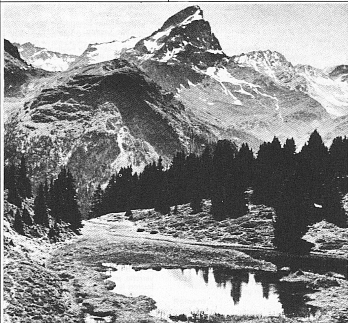
Alp Flix mit Piz Platta, Oberhalbstein.

Auskunft und Prospekte: Ihr Reisebüro oder Verkehrsverein, Postfach 198, 7270 Davos Platz