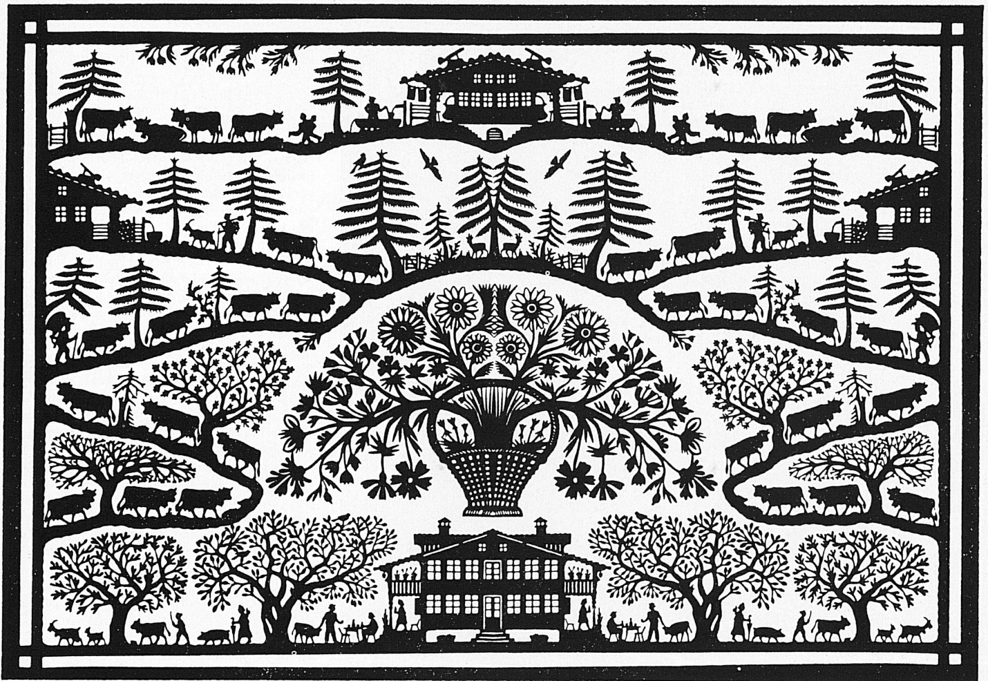
◀ Verena Broger: Alpauzug im Appenzellerland / Montée à l'alpage en Appenzell Salita all'alpe nell'Appenzellerland / Departure for the Mountain Pastures, Appenzell