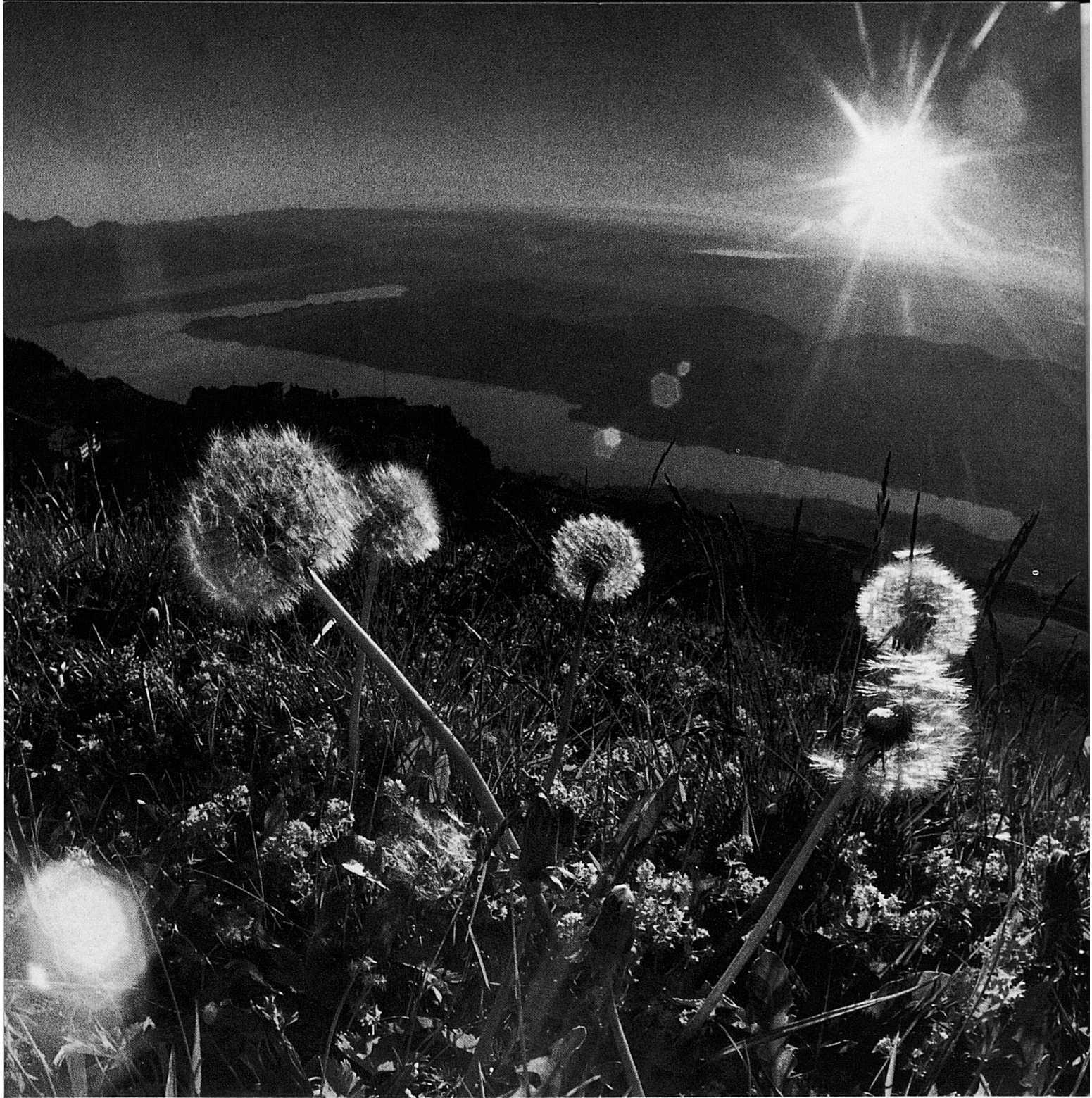
Belohnte Rigi-fahrt: Morgenlicht über der Seebucht von Küsnacht am Rigi. Une montée au Rigi récompensée: L'aurore resplendit au-dessus de la baie de Küsnacht (canton de Schwyz) Escursione al Rigi veramente ripagata: Luce mattutina sulla baia del lago di Küsnacht al Rigi Another view from the Rigi: Morning light over the bay of Küsnacht