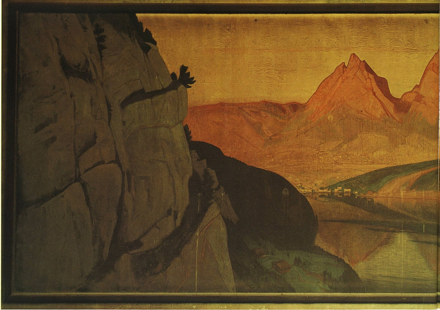
Ernst Hodel (1881–1955): Urnersee mit Rütli, um 1927, Öl auf Leinwand, 15 × 5 m, in der Bahnhofhalle Basel SBB

Die Vierwaldstättersee-Landschaft im Bahnhof Basel SBB wurde von Ernst Hodel nach dem Vorbild von Charles Giron's «Wiege der Eidgenossenschaft» im Parlamentsgebäude in Bern gemalt. Dieses Motiv ist von der Auftraggeberin, der Schifffahrtsgesellschaft des Vierwaldstättersees, bestimmt worden, nachdem sich der Luzerner Hotelierverein vom ursprünglich vorgesehenen Kollektivklamegemälde «Musegg mit See und Alpen» wegen mangelnder Erfolgsaussichten zurückgezogen hatte