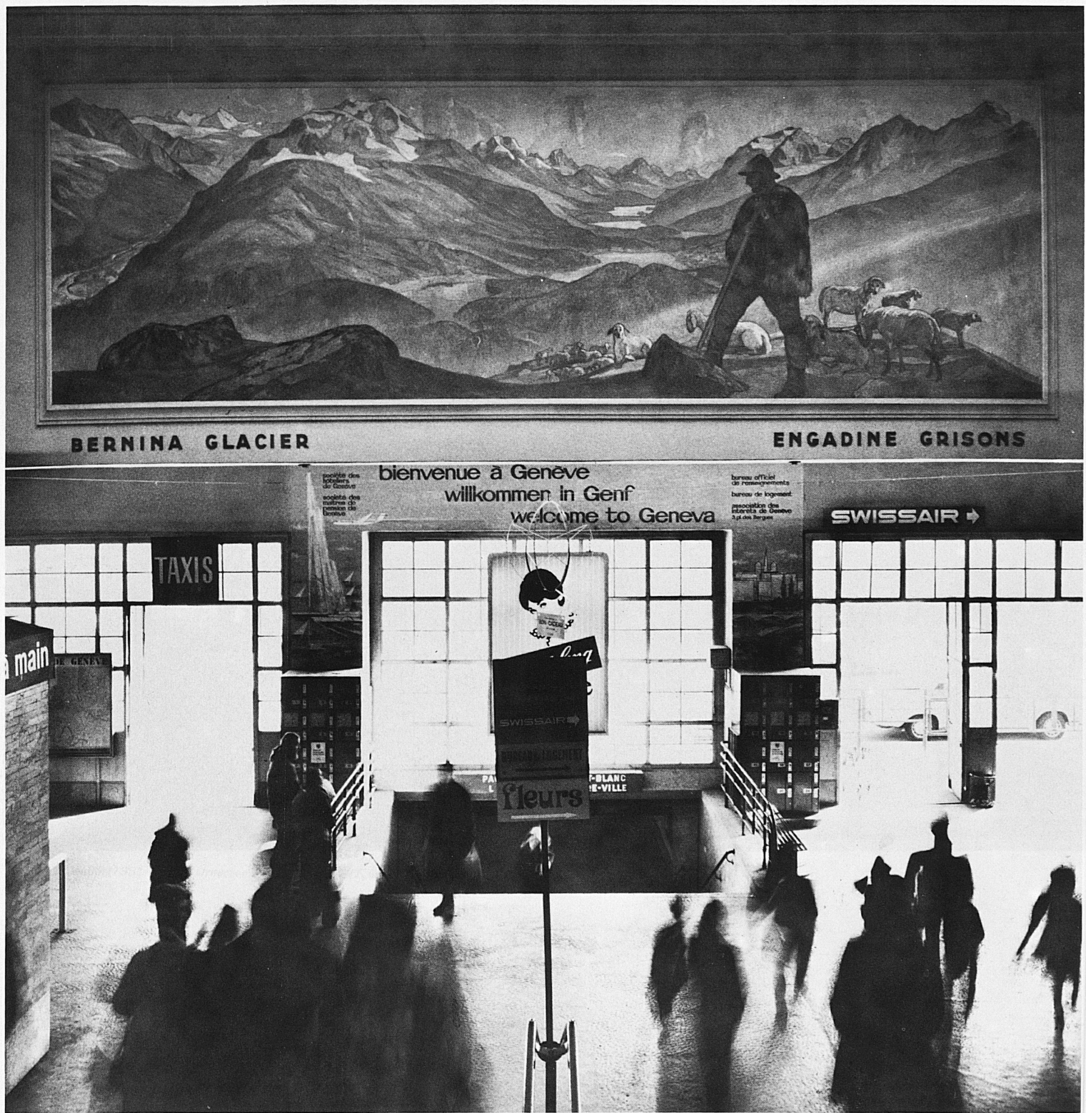
Hans Beat Wieland (1867–1945): Engadin mit Bernina, 1930, Öl auf Leinwand, 200 × 600 cm, Bahnhof Genève-Cornavin

Die Rhätische Bahn hat unter acht fassbaren Aufträgen viermal die Berninagruppe malen lassen. Das Panorama «Engadin mit Bernina» von H. B. Wieland im Bahnhof Genf verdeutlicht die Tendenz dieser Reklamebilder, möglichst zeitlose Landschaften als Markenartikel der betreffenden Auftraggeber anzupreisen.