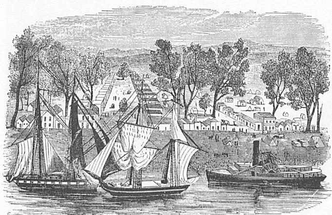
Sacramento City, die Hauptstadt Kaliforniens, zur Zeit ihrer Gründung auf dem Boden Neu-Helvetiens / Sacramento, capitale de la Californie, à l'époque où elle fut fondée sur le territoire de la Nouvelle-Helvétie / Sacramento City, la capitale della California al tempo della sua fondazione sul terreno della Nuova Elvezia / Sacramento City, capital of California, at the time of its foundation on the territory of New Helvetia