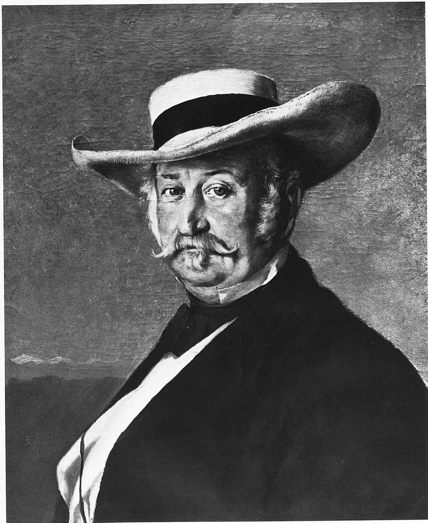
Frank Buchser (1828–1890): General Sutter, 1866, 69,5 × 54,5 cm, Museum der Stadt Solothurn.