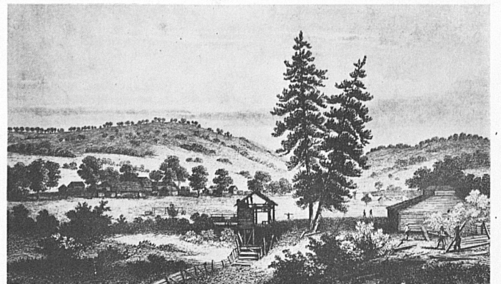
Die Sägemühle, wo 1848 die verhängnisvollen «Nuggets» gefunden wurden, die den kalifornischen Goldrausch auslösten und das Ende Neu-Helvetiens herbeiführten