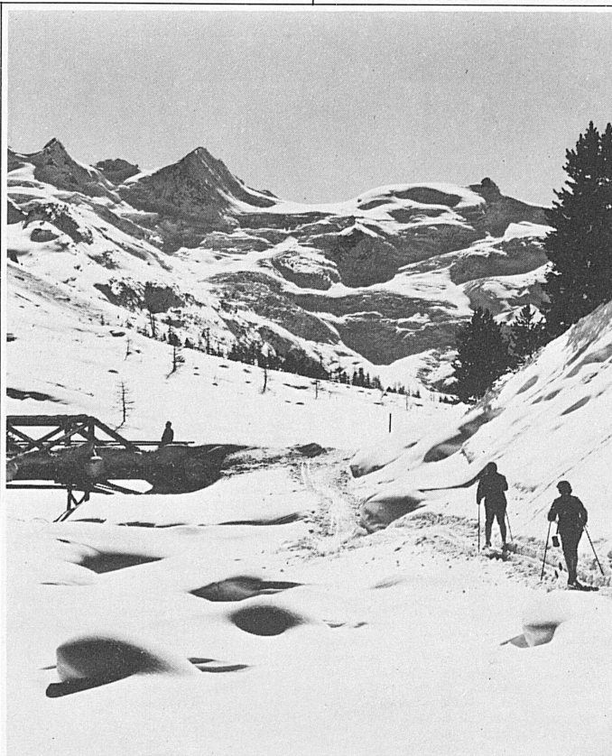
Skiwandern im Val Roseg, mit Sellagruppe, Pontresina

Auskunft und Prospektmaterial: Kurverein Arosa, 7050 Arosa Telefon 081 31 16 21