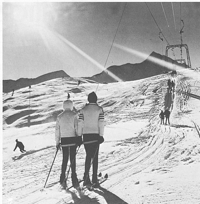
Splügen: Skilift Danaz mit Piz Tambo

Verlangen Sie Spezialprospekt beim Kur- und Verkehrsverein 7250 Klosters Telefon 083 41877/78 oder Klosters Dorf 083 41978