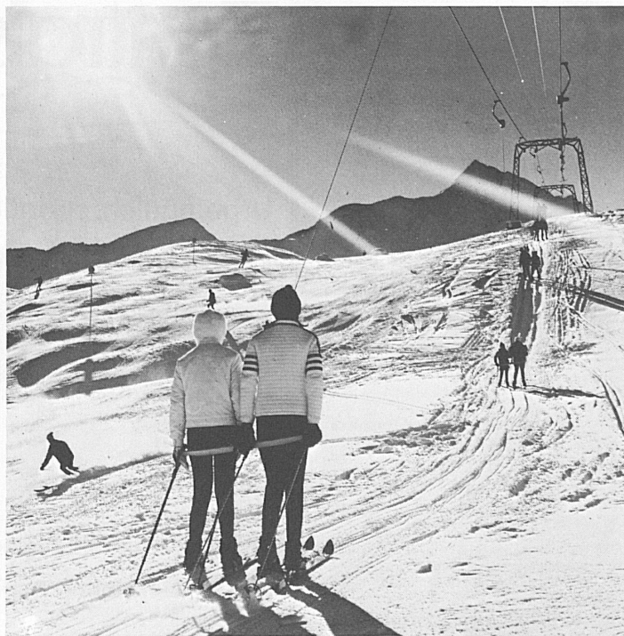
Splügen: Skilift Danaz mit Piz Tambo

Verlangen Sie Spezialprospekt beim Kur- und Verkehrsverein 7250 Klosters Telefon 083 41877/78 oder Klosters Dorf 083 41978