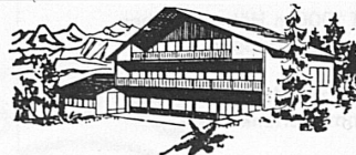
Hotel Lüderalp 3457 Wasen i. E.

Verkehrsverband Emmental, 3550 Langnau, Telefon 035 2 34 34 Emmental-Burgdorf-Thun-Bahn, Werbedienst, 3400 Burgdorf, Telefon 034 2 31 51