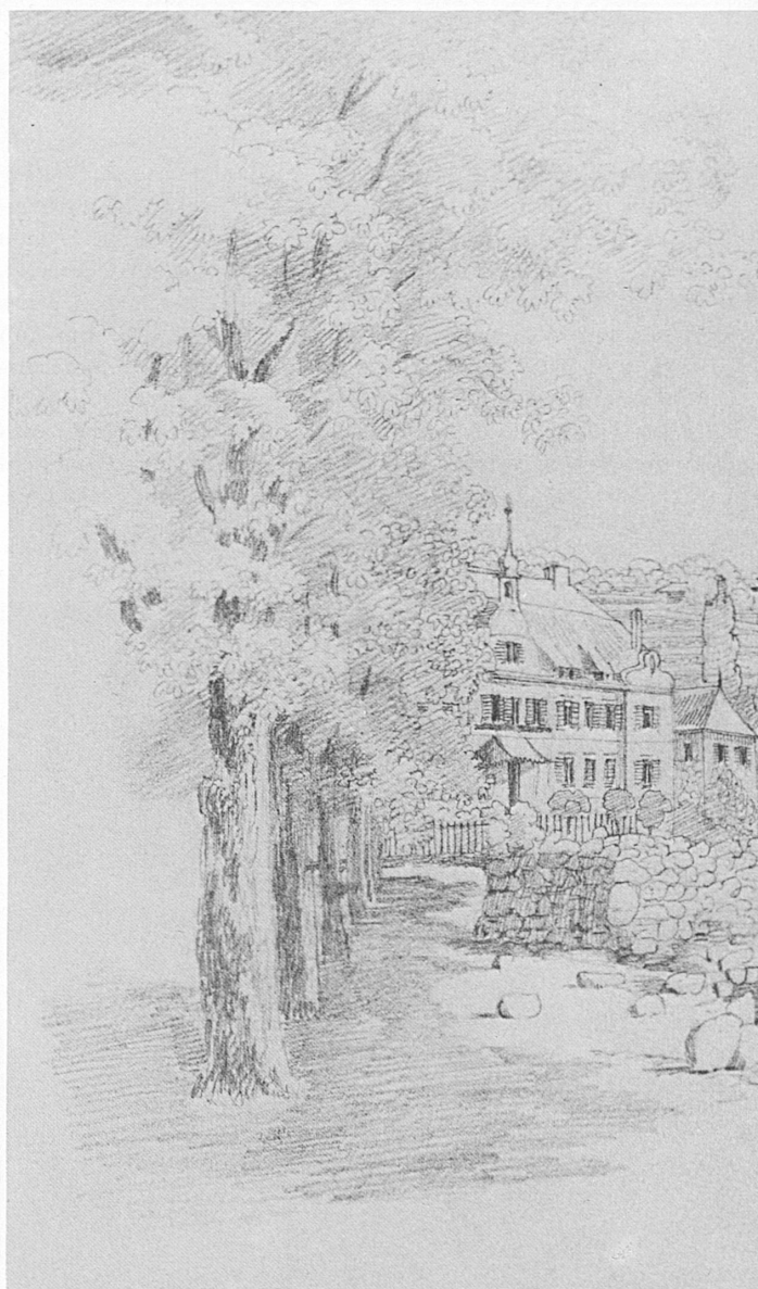
Lausanne-Ouchy en 1842, dessin de Félix Mendelssohn. A gauche, l'Hôtel de l'Ancre où lord Byron composa «Le Prisonnier de Chillon», poème qui contribua à faire connaître dans le monde le célèbre château

rische Berufung nie der geringste Zweifel: das musikalische Genie äusserte sich früh und eindeutig. Mendelssohns Bilder sind aus reiner Freude am Zeichnen und aus Liebe zur dargestellten Landschaft entstanden. Zeichnen war für ihn ein echtes Hobby, ein leidenschaftlich gepflegtes, wie aus folgender Briefstelle hervorgeht: «Schweizer Beschreibungen sind ja gar nicht zu machen, und statt eines Tagebuchs wie das vorige Mal zeichne ich diesmal ganz wütig darauf los, ich sitze tagelang vor einem Berg und suche ihn nachzumachen.» Vielleicht ist es diese Zeichenwut, die ihn davor bewahrte, das Erlebnis der Schweizer Landschaft unmittelbar in Musik umzusetzen. Zwar ist auch für Mendelssohn, den Romantiker, die Natur Quelle seines Schaffens, doch gelangte er nicht zur Tonmalerei wie Liszt, der zur gleichen Zeit in Genf lebte und in seinen frühen Klavierwerken, den «Années de Pèlerinage» etwa, Landschaftseindrücke unmittelbar wiedergab («Les cloches de Genève», «Le lac de Walenstadt», «La Chapelle de Guillaume Tell» . . .) und auch schweizerische Volksmelodien verarbeitete.